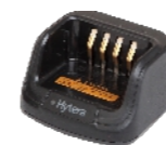
Chargeur rapide MCU (pour batteries Li-ion/Ni-MH) CH10A07