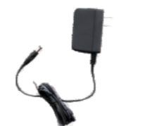
Adaptateur secteur à découpage